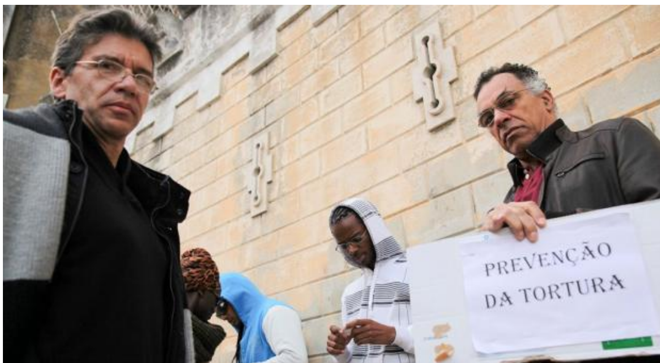
Manifestação contra tortura na prisão de Lisboa