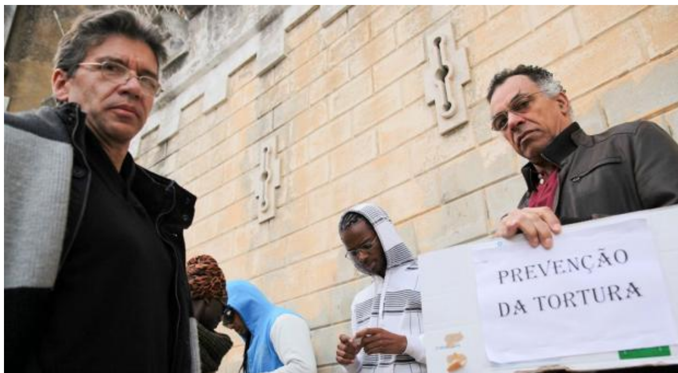
Manifestação contra tortura na prisão de Lisboa