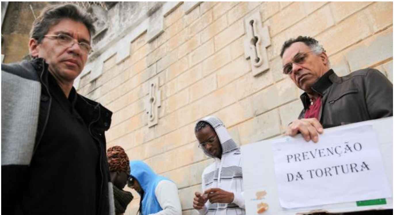
Manifestação contra tortura na prisão de Lisboa