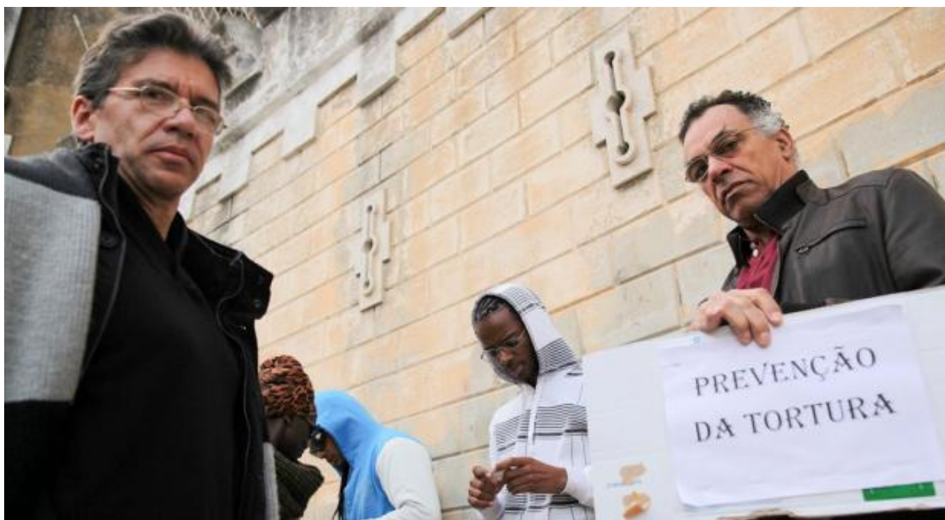
Manifestação contra tortura na prisão de Lisboa