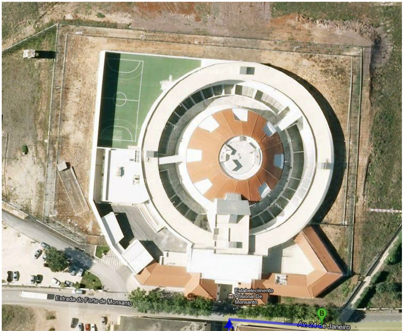
Prisão de Monsanto, Lisboa