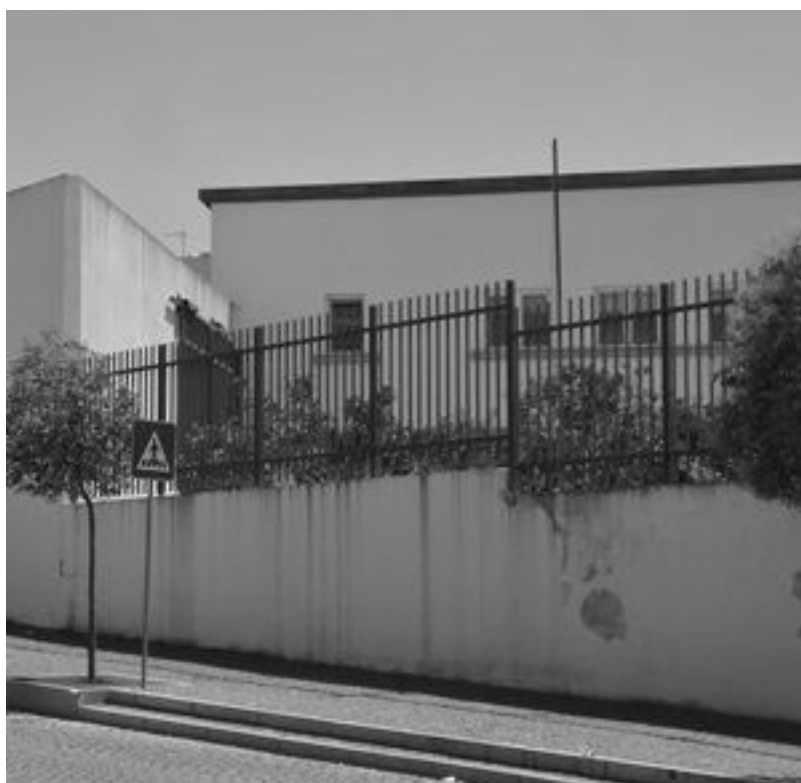
Cadeia de Beja

Muitos são os reclusos que se queixam de viver uma situação desumana. Além da violência a que são sujeitos, é-lhes negado o respeito pelas necessidades primárias. Na prisão de Beja a fome parece ser uma constante, segundo as queixas dos reclusos. Em carta anónima de Dezembro/2012, publicada no jornal Diário do Alentejo , tal situação é denunciada de modo claro: «Os reclusos da prisão de Beja queixam-se aos seus familiares de fome, além da comida ser de muito má qualidade (carne de frango verde e azulada por dentro) e pouca. Os rapazes entram para lá e ao fim de duas semanas já estão a ficar esqueléticos». Acresce a este problema a falta de condições nas instalações, repetidamente denunciadas e ventiladas pelas associações já referidas.