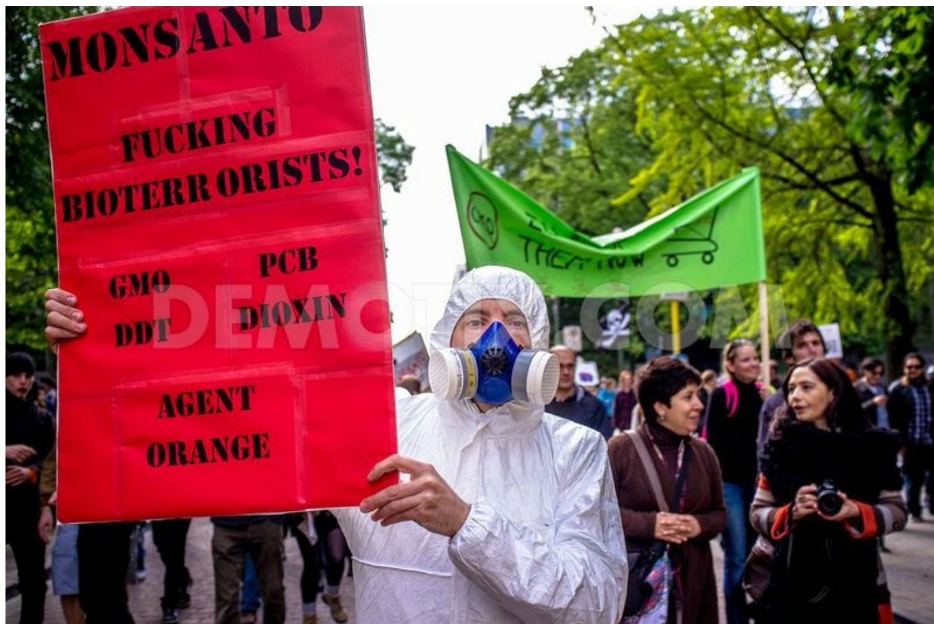
Manifestante passa a mensagem contra a Monsanto, em Bruxelas, Bélgica

A luta concertada chegou também ao continente africano, que se juntou em 2011 ao combate da proliferação transgénica que ameaça a multiplicidade da herança natural – foi criada a Aliança para a Soberania Alimentar em África, constituída por grupos de pastores, pescadores, povos indígenas, organizações ecologistas (como a Amigos da Terra África) com o intento de mobilizar a expressividade da agricultura e das pescas, buscando soluções comunitárias que façam frente aos interesses corporativos que assolam a liberdade e integridade dos povos. Na Europa, vários têm sido os países a alinharem contra a predominância dos OGM: na Bulgária, Luxemburgo, Hungria e Grécia o cultivo e a venda de transgénicos foram totalmente banidos pela legislação nacional; na Hungria, mil hectares foram destruídos, em 2011, depois de encontrados campos de cultivo de milho geneticamente modificado.