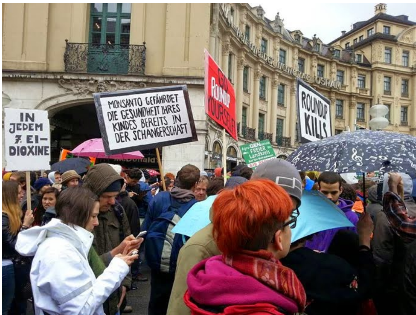
Manifestantes marchando pelas ruas de Munique, Alemanha, exigindo a proibição dos OGM